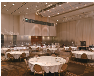
コンベンションホール淡海